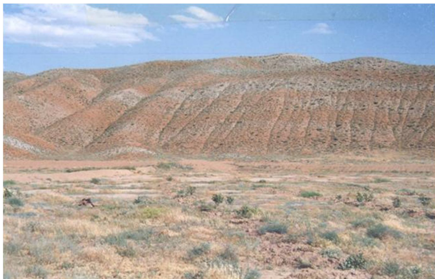
شکل ۳. نمایی از واحد M_2^{mg} شامل مارن‌های گچی - نمکی به‌عنوان حساس‌ترین واحد مارنی منطقه