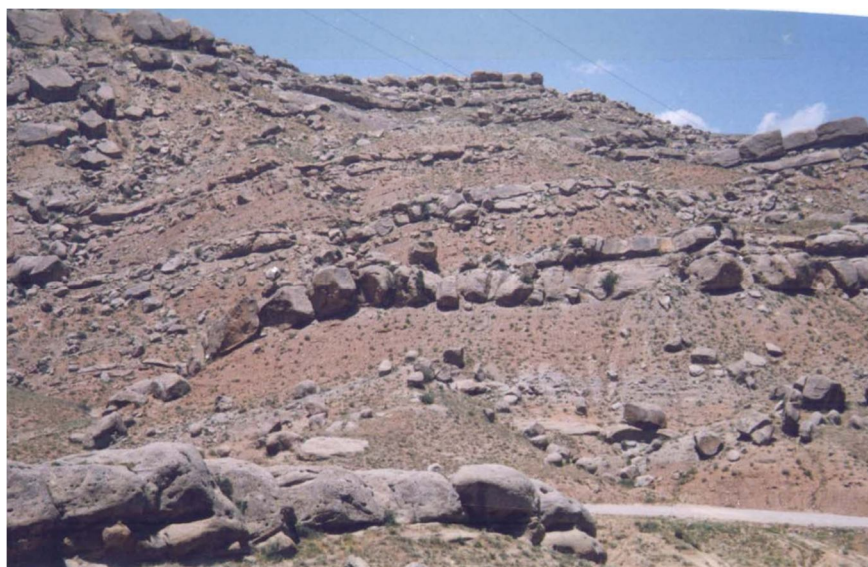
شکل ۴. نمایی از واحد مارنی مقاوم به فرسایش M_4^{SC} شامل تناوب مارن، ماسه‌سنگ و کنگلومرا

پس از تهیه‌ی نقشه‌ی مورد نظر، از اشکال مختلف فرسایش شامل شیاری، خندقی، هزاردره‌ای و توده‌ای سازند مارنی انتخاب شده ( M_2^{mg} ) نمونه گرفته شد. در مورد فرسایش‌های خندقی (در عمق ۲۰ تا ۳۰ سانتی‌متری از سطح زمین) و شیاری (در عمق ۵ تا ۱۵ سانتی‌متری از سطح زمین) از قسمت ابتدا، انتها و میانی آنها نمونه‌ای گرفته شد و یک نمونه‌ی مرکب از آن برای کاهش تعداد نمونه‌ها، تهیه شد. در مورد فرسایش‌های توده‌ای و هزاردره‌ای، سه نمونه از قسمت‌های مختلف سطح فرسایش یافته به‌صورت تصادفی تهیه و از آنها یک نمونه‌ی مخلوط‌شده همگن یا مرکب تهیه شد. از فرسایش‌های مختلف شیاری، خندقی، توده‌ای و