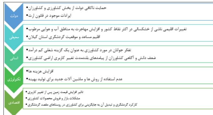
شکل ۱. علل تغییر کاربری اراضی در استان گیلان (Akbari et al., 2025)

مهم‌ترین نمود آن اینکه گردشگری در این منطقه در چند دهه اخیر در حال تبدیل شدن به جایگزین کشاورزی یا کارکرد اول و محرک قوی تغییر کاربری اراضی مولد شده است. موقعیت ممتاز جغرافیایی و گردشگری شهرستان رشت نسبت به سایر استان‌ها که در دهه‌های اخیر با مخاطرات طبیعی از جمله خشکسالی و فرونشست زمین، آلودگی هوا مواجه‌اند، باعث افزایش ورود مهاجران به این استان است. از این رو، مهاجرپذیری نقاط روستایی منطقه و تأثیر تقاضای زمین برای کاربری غیرکشاورزی موجب افزایش قیمت زمین شده است. کشاورزان نیز به علت بهره‌وری پایین بخش کشاورزی، افزایش هزینه‌های تولید، قانون ارث، کوچک شدن اندازه زمین و به صرفه نبودن تولید، ضعف حمایت بهینه و مستمر از بخش تولید و عرضه محصولات، تلقی نسبت به کشاورزی به‌عنوان یک گزینه شغلی کم‌درآمد، تأثیر مدرنیته و گردشگری سبب شده که گردشگری در حال تبدیل شدن به جانشینی برای کشاورزی شود. بر این اساس، شکل ۱، برخی از علل دولتی، انسانی، تکنولوژیکی و اقتصادی مؤثر بر تغییر کاربری اراضی مولد را در استان گیلان و محدوده مورد مطالعه را نشان می‌دهد.